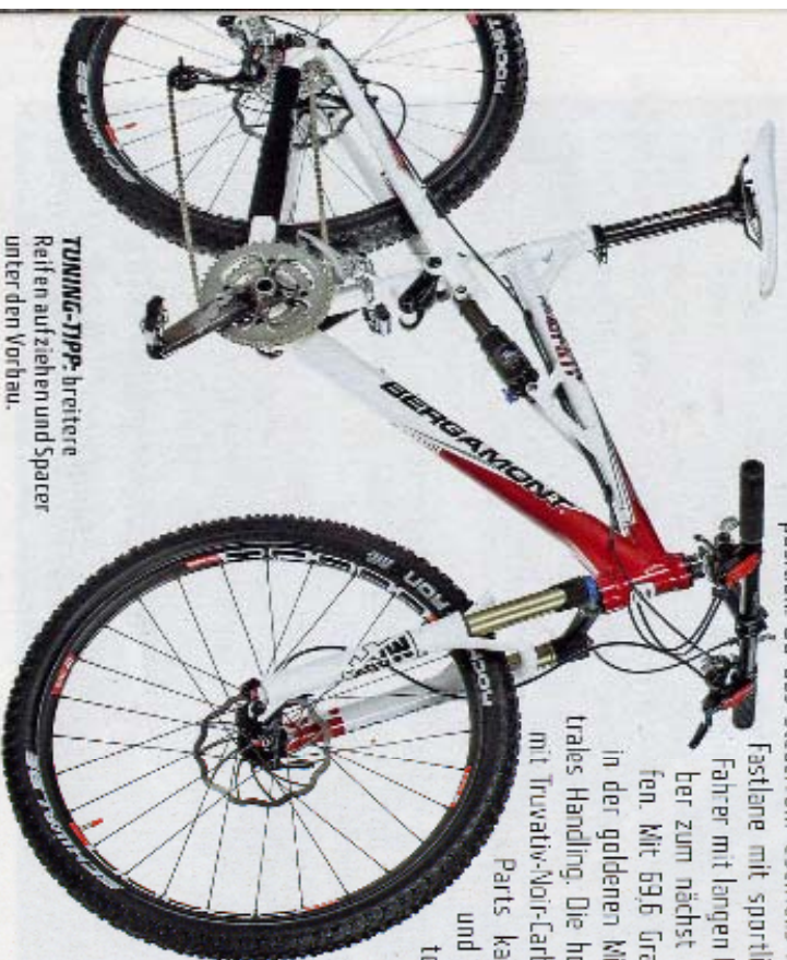
TUNING-TIPP: breitere Reifen aufziehen und Spacer unter den Vorbau.

FAZIT: Das Fastlane überzeugt mit einem feinfühligem wie effizientem Hinterbau und wertiger Ausstattung. Die Sitzposition fällt eher kurz aus.