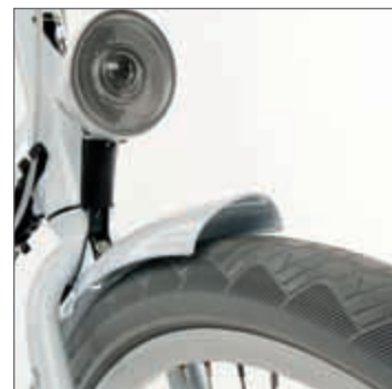
Neue Optik gepaart mit hoher Dämpfungsqualität: Ballonreifen am Diva.