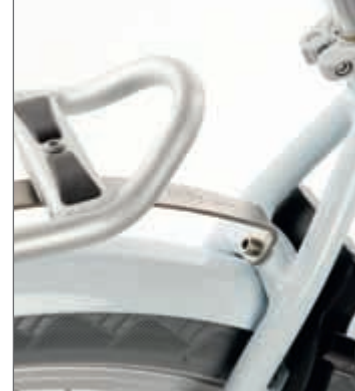
Feste Verbindung: eine stabile Lasche unterstützt den Gepäckträger.