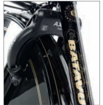
Alles inklusive: Aufwändige Dekore, Folienmantelschutz, Rahmenschluss