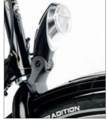
Puristen würden sich bei der Frontlampe ein Metallgehäuse wünschen.