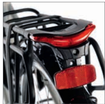
Typisch Hollandrad: System-Integration. Hier beim Rücklicht gut zu sehen.