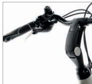
Mit einem Hebel lassen sich Vorbau und Lenker individuell verstellen.