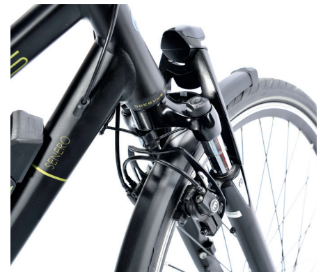
Die auflaufend montierte hydraulische Felgenbremse HS 11 von Magura.

Das Batavus Senero E-go ist ein komfortables & agiles Universalrad für Stadt & Land mit gutem Antrieb und pfliffigen Details.