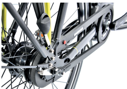
Der Hebie Chainglider-Vollkettenschutz vermeidet Schmutz an Hose und Kette.

T raditionshersteller Batavus hat mit dem Senero E-go ein Pedelec im modernen Hollandstyle im Programm. Bekannt und beliebt sind die Batavus-Entwickler aus Heerenveen unter anderem wegen ihrer originellen und nutzerfreundlichen Detaillösungen. Da finden wir zum Beispiel einen nach hinten und vorne abklappbaren Seitenständer. Das Rad kann rückwärts geschoben werden, der Ständer weicht dank dem rückrotierenden Pedal aus. Pfliffig auch die aufgeräumt gebündelte Zugführung am Steuerrohr mittels Schlaufe. Der Trapezrahmen mit Federgabel wird von einem Yamaha Mittelmotor unterstützt, der in der Spitze kräftige 80 Nm leistet. Der 400 Wh-Akku liegt gewichtsoptimiert auf dem Unterrohr in der Rahmenmitte.