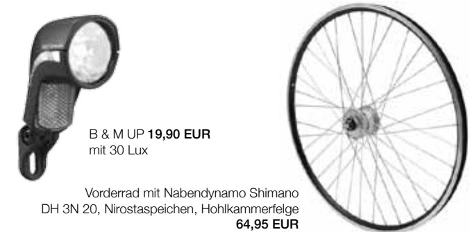
B & M UP 19,90 EUR mit 30 Lux

Wir montieren Ihnen eine Lichtenanlage bestehend aus Vorderrad mit Nabendynamo Shimano DH 3N 20, Nirostaspeichen, Hohlkammerfelge und Scheinwerfer B & M UP mit Nahfeldausleuchtung sowie Kleinteilen und Montage ab 100,- EUR