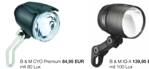
B & M CYO Premium 84,95 EUR mit 80 Lux

Core, Fyre und IXXI sind mit Lithium-Akkus ausgestattet und lassen sich wie ein Handy jederzeit am PC laden.