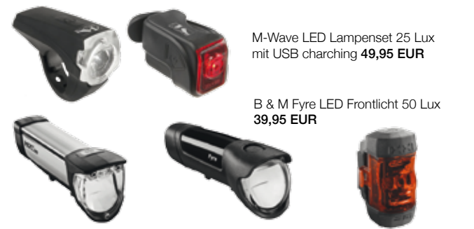
M-Wave LED Lampenset 25 Lux mit USB charging 49,95 EUR

Für höherwertige Ausführungen der Lichtenanlage beraten wir Sie gern.