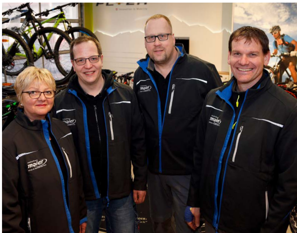
Das Service Team von Zweiradhaus Maier

schon auch sozial unterwegs und sehen die Bereitstellung eines Ausbildungsplatzes als Verpflichtung den jungen Menschen gegenüber. Gleichzeitig wird der qualifizierte Nachwuchs gesichert“. Aktuell arbeitet in der Werkstatt ein Langzeitpraktikant im Rahmen seiner Umschulung zum Fahrradmechaniker. Nach Abschluss seiner Umschulung könnte er in ein Angestelltenverhältnis übernommen werden.