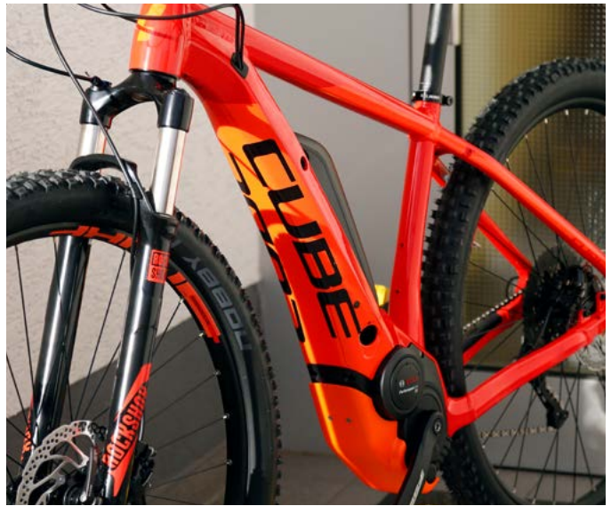
Die neue Rahmentechnologie mit der Integration des Akkus im Rahmen schafft neue Möglichkeiten

„Plus“ steht dabei für breitere, dickere Reifen mit mehr Fahrkomfort durch höhere Dämpfung, bessere Fahreigenschaften durch ein Mehr an Spurführung vor allem über Dreck, Matsch und Wurzeln verbunden mit weniger platten Reifen durch die hohen Dämpfungsei-